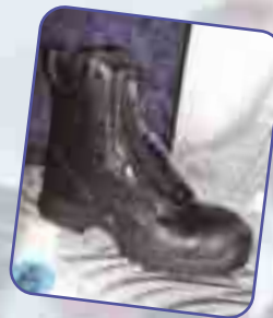
Neu! Airpower X1 von Haix