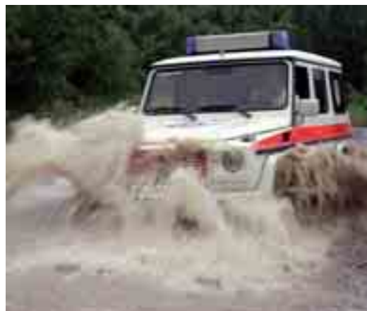
Titelfoto: Hochwasser in Bayern

Druck: LANDRUCK GmbH München ; Auflage: 9.000 Preis durch Umlage abgegolten